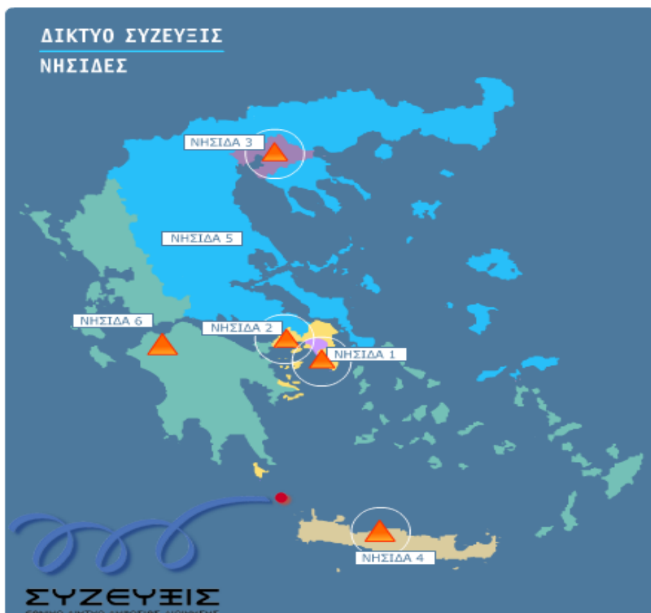
Σχήμα 1: Νησίδες ΣΥΖΕΥΞΙΣ

Ουσιαστικά, το δίκτυο ΣΥΖΕΥΞΙΣ εξασφάλισε για πρώτη φορά για τους φορείς που συμμετείχαν σε αυτό σύγχρονες τηλεπικοινωνιακές υποδομές, ευρυζωνική πρόσβαση πολύ υψηλών συμμετρικών ταχυτήτων (από 2 έως 34 Mbps) καθώς και μια σειρά κεντρικών υποδομών ώστε να υλοποιηθούν οι αντίστοιχες υπηρεσίες.